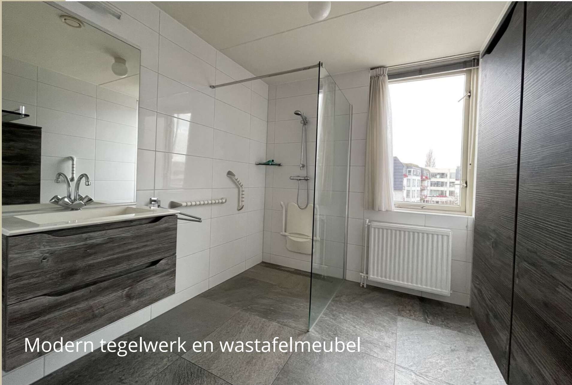
Modern tegelwerk en wastafelmeubel