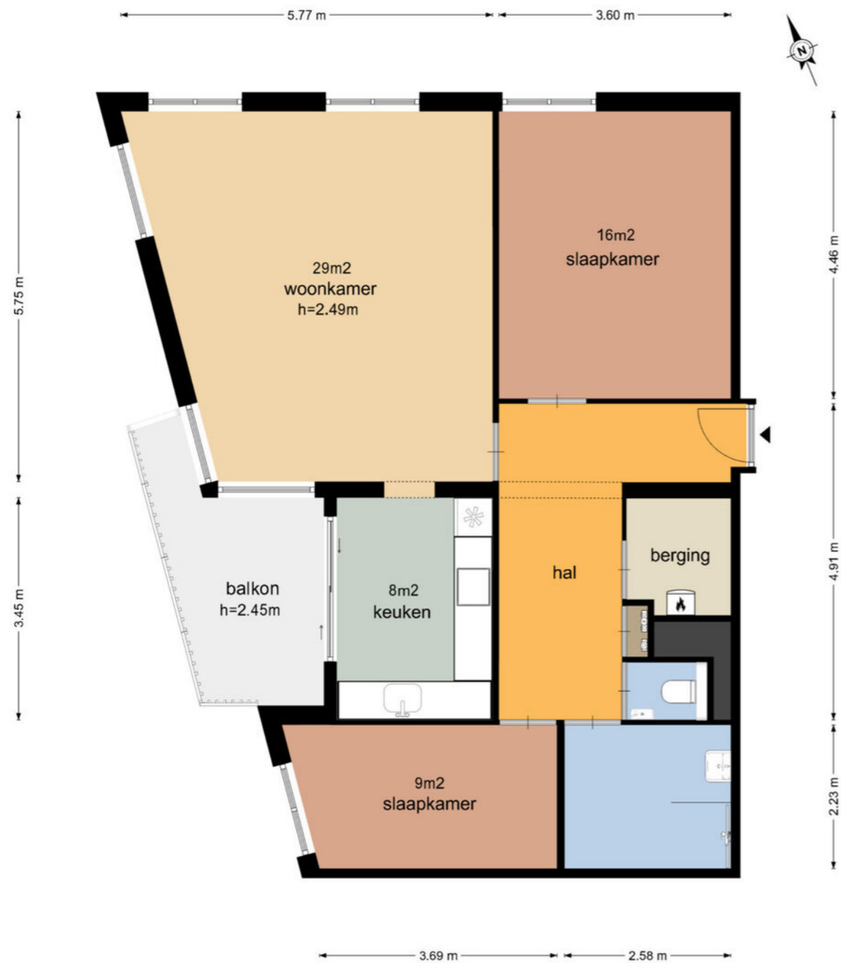
Frankrijkstraat 58 - IJsselstein Vierde Verdieping

De plattegronden zijn geproduceerd voor promotionele doeleinden en ter indicatie. Aan de plattegronden kunnen geen rechten worden ontleend © www.vistaview.nl