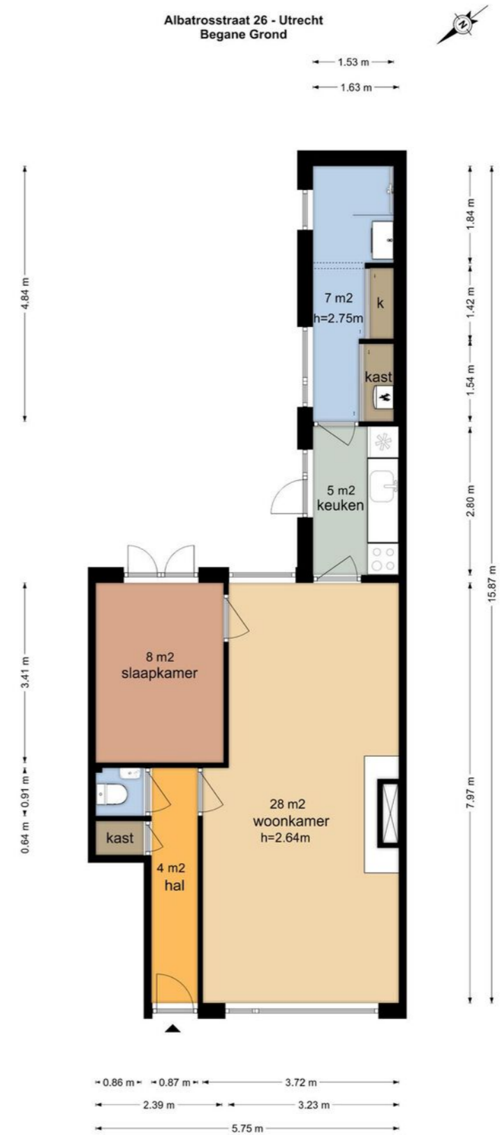
Albatrosstraat 26 - Utrecht Begane Grond

De plattegronden zijn geproduceerd voor promotionele doeleinden en ter indicatie. Aan de plattegronden kunnen geen rechten worden ontleend.